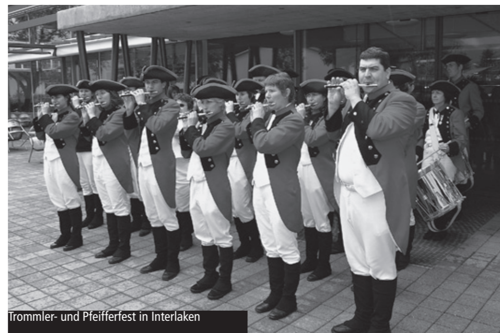
Trommler- und Pfeifferfest in Interlaken