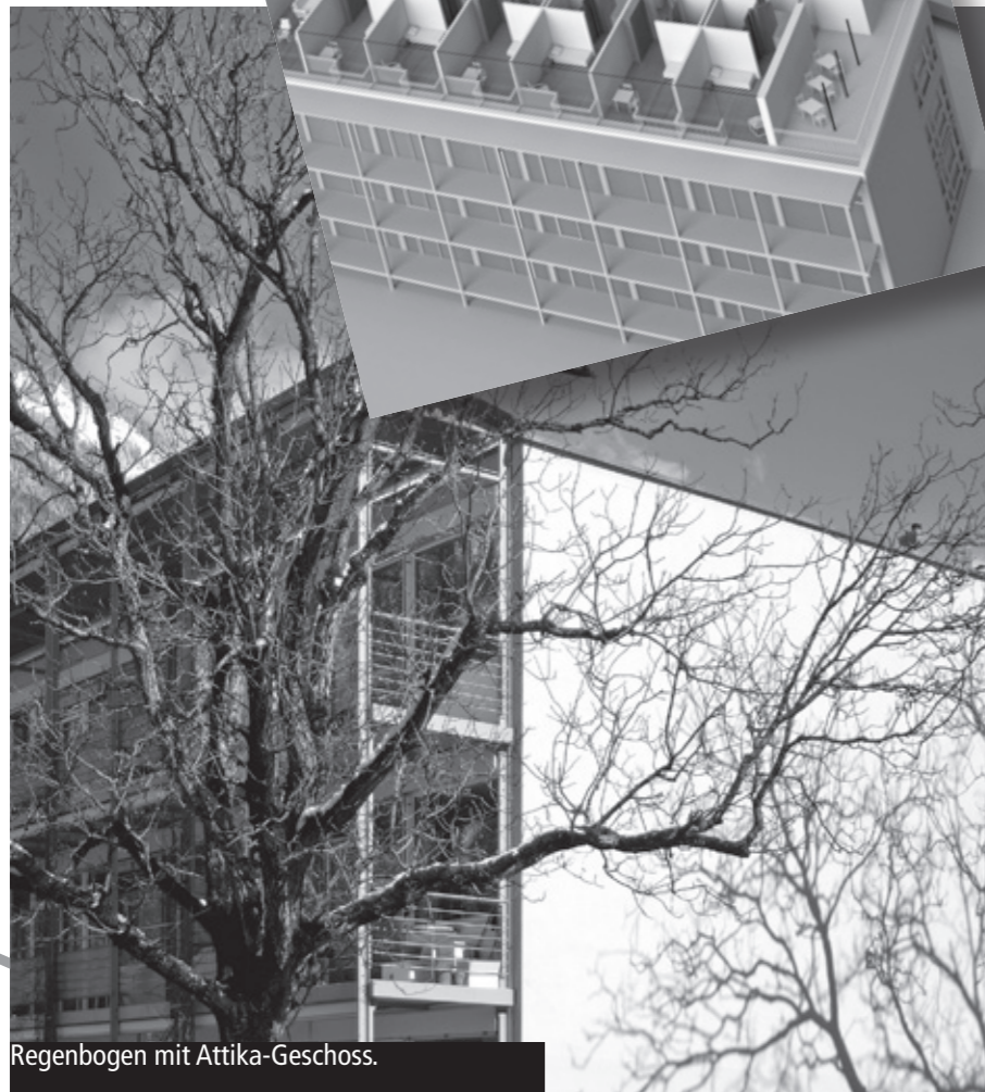
Regenbogen mit Attika-Geschoss.