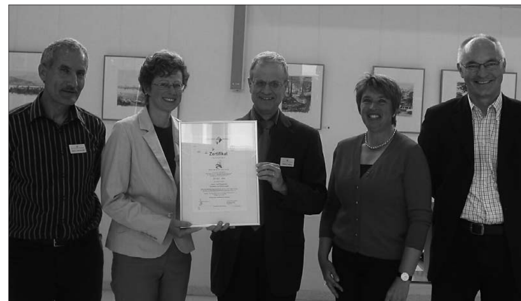
Grosse Freude an der Zertifikatsübergabe.