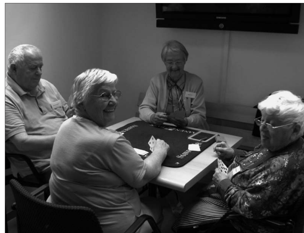
Jassen macht Spass!

Wir gratulieren herzlich und wünschen beim Start ins eigenständige Berufsleben oder in die neue Verantwortung alles Gute und viel Freude im Berufsalltag.