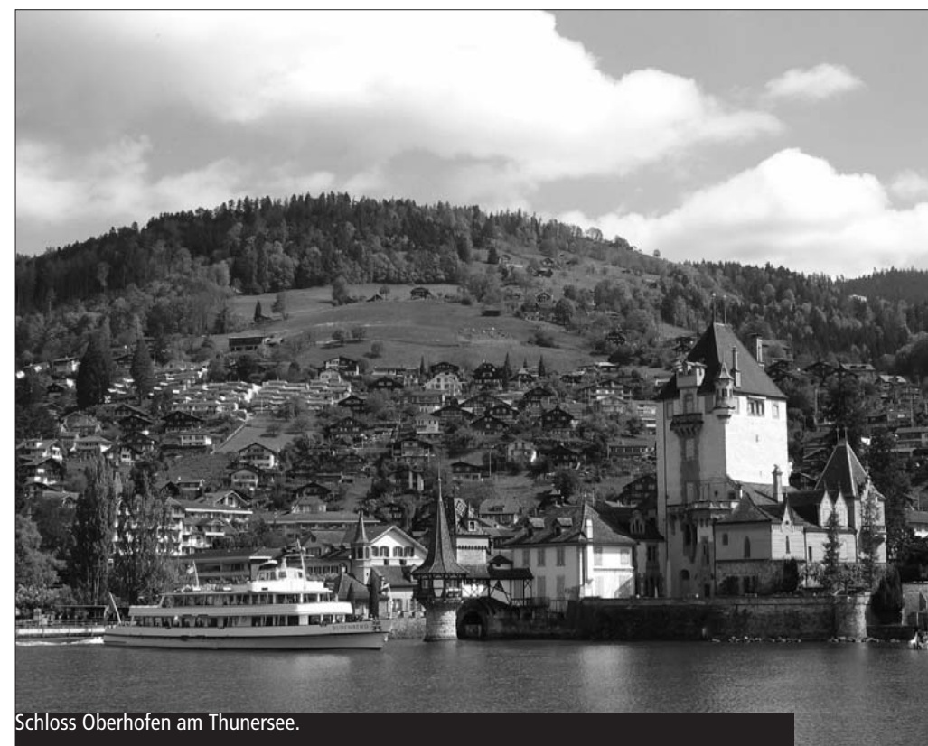
Schloss Oberhofen am Thunersee.

Für Hotelgäste, die Halb- oder Vollpension gebucht haben, sind die Buffetabende im Preis inbegriffen. Für Gäste, die Übernachtung und Frühstück gebucht haben, kostet das Buffet CHF 28.–; für Auswärtige CHF 35.– pro Person. Wir freuen uns auf Ihre Reservation!